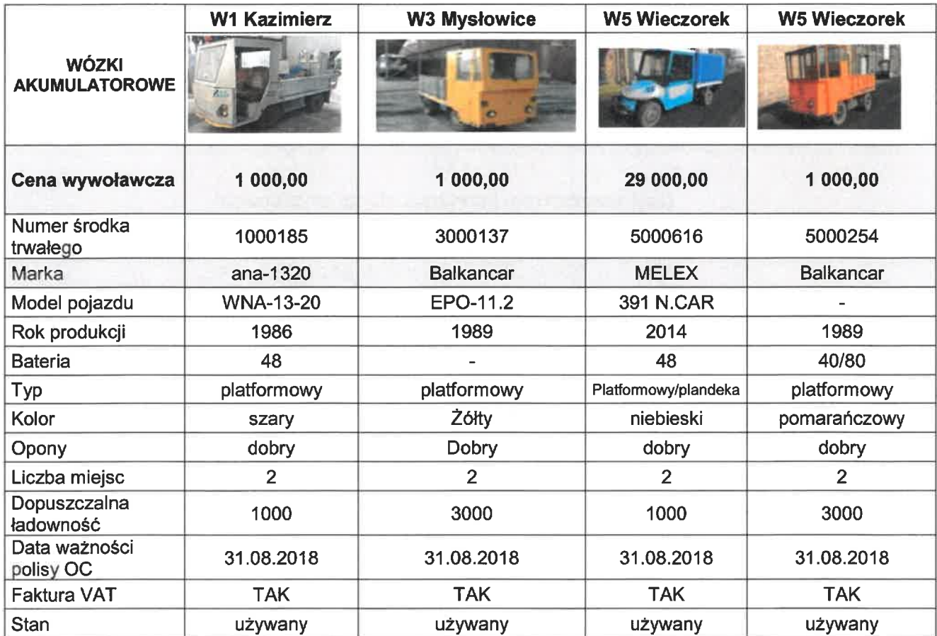
Tabela Nr 1 b/ wózki akumulatorowe: