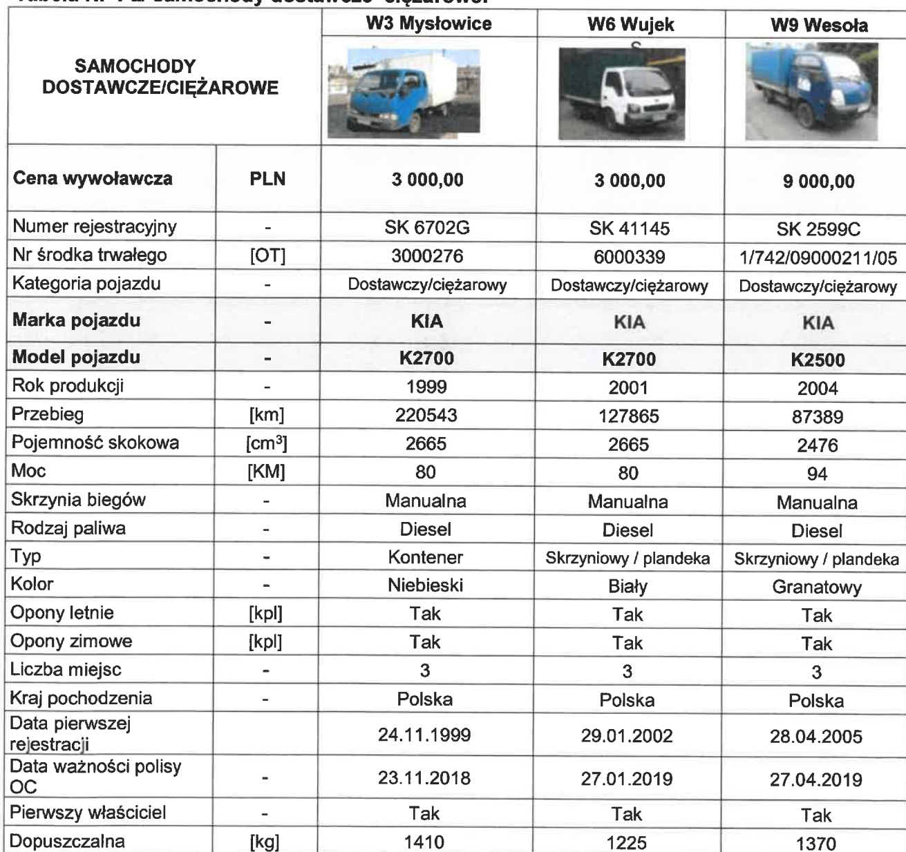
Tabela Nr 1 a/ samochody dostawcze ciężarowe:

Przedmiotem sprzedaży są samochody dostawcze ciężarowe oraz wózki akumulatorowe ZEC S.A. (dalej: ZEC) wg poniższego zestawienia: